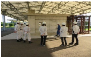
①コンクリート打設現場実習