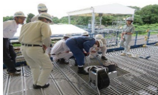
⑤管路内テレビカメラ調査実習