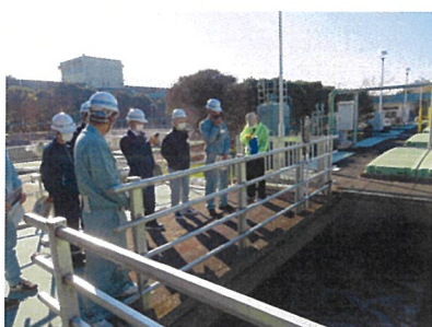
水処理施設の見学